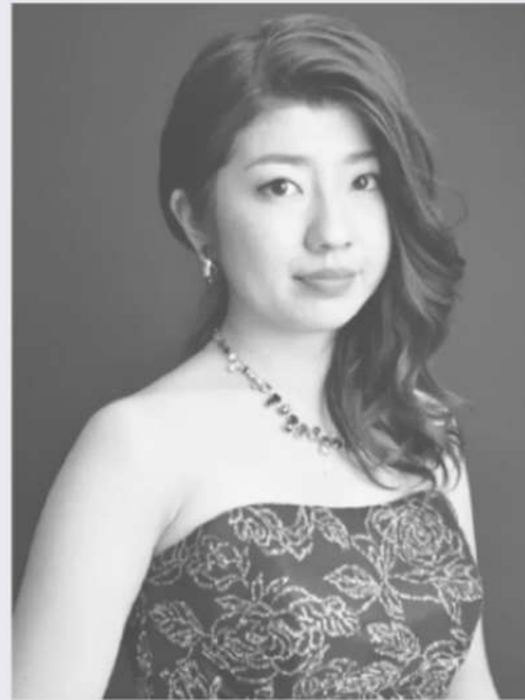
Mezzo soprano 田中 沙友里