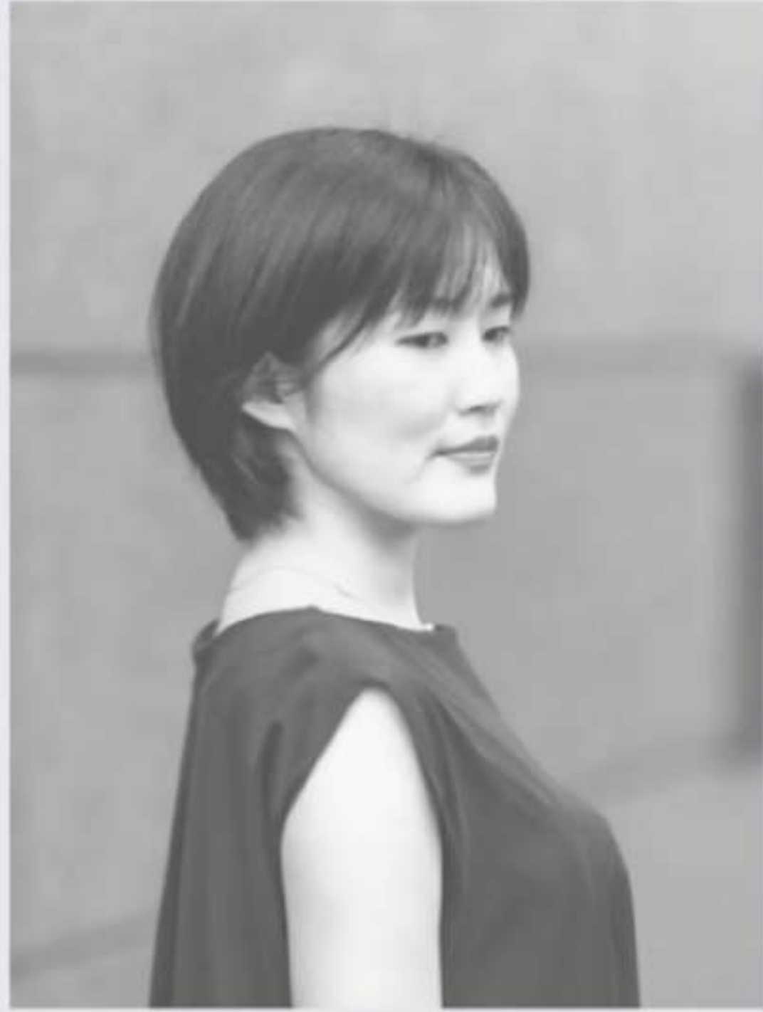
Mezzo soprano 小巻 風香