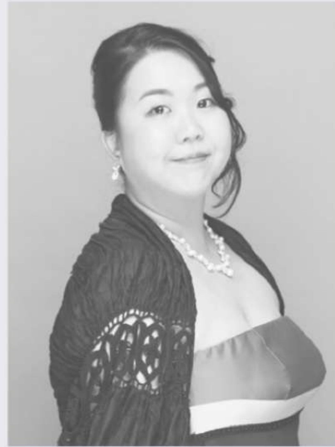
Soprano 田村 幸代