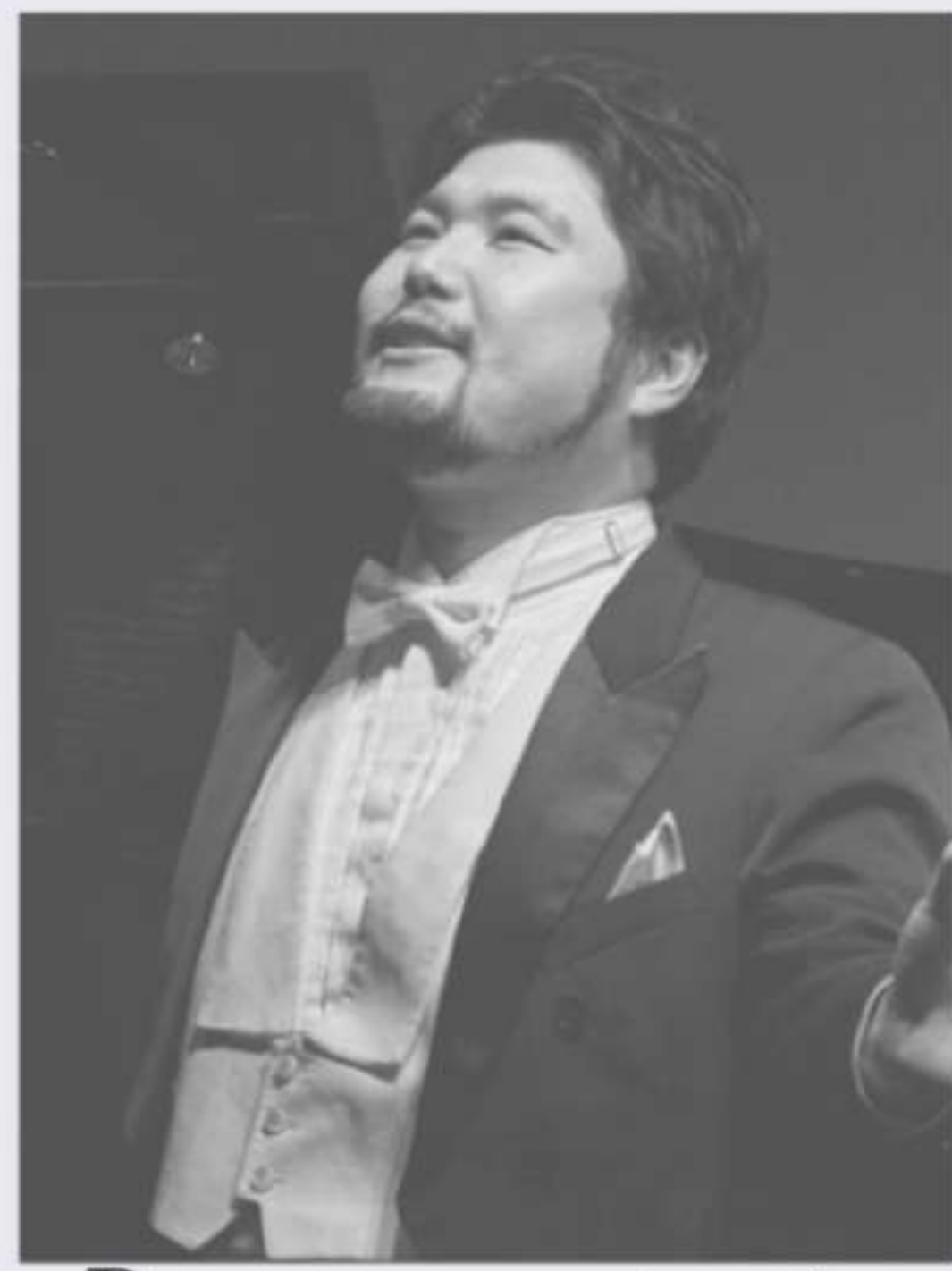
Basso cantante 奥秋 大樹