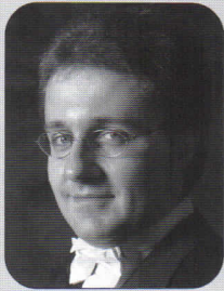
指揮 ヴィート・クレメンテ