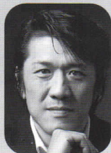
ベルの大祭司 党 主税