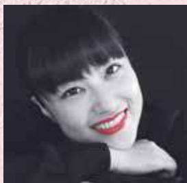
ヤマザキーナ 俳優(4期生)